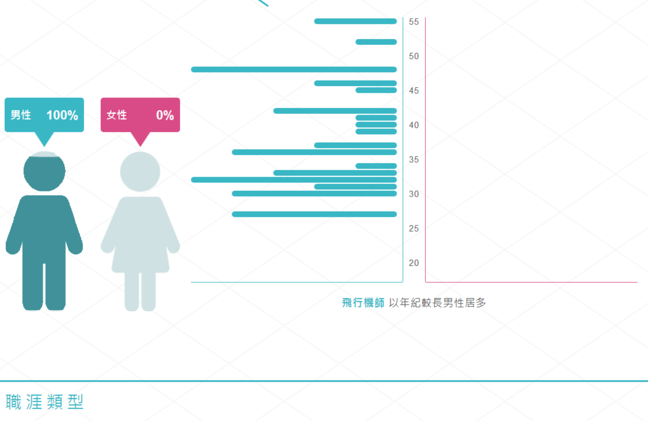
飛行機師 以年紀較長男性居多